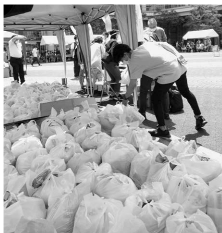
▲お渡し用食材セット 300食分