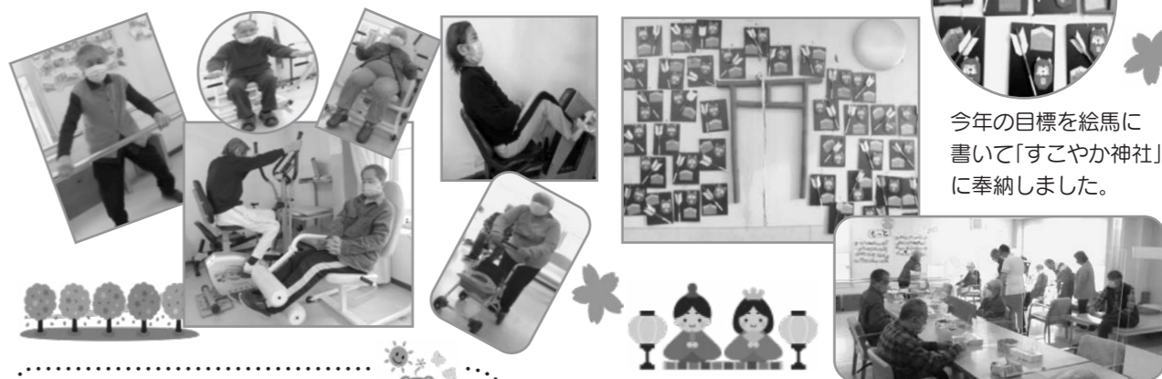
今年の目標を絵馬に書いて「すこやか神社」に奉納しました。

旧デイケア最終週のリハビリ風景。 皆さん今まで以上に真剣に取り組まれていました。